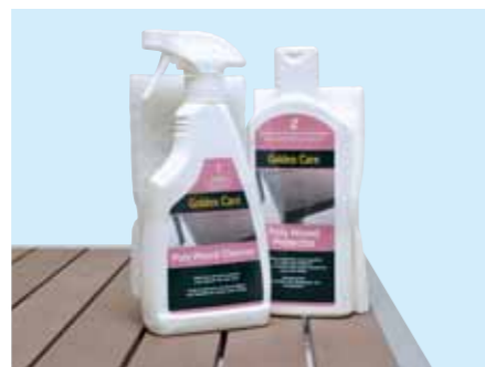
⑥ ポリウッドクリーナー ¥2,625 (本体価格¥2,500) NEW 容量/500ml 水溶性