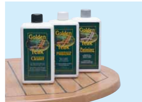
① ゴールデンチーク・クリーナー ¥4,200 (本体価格¥4,000) 容量/1,000ml 水溶性