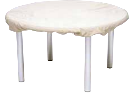
① テーブルカバー CP905 Table Cover CP905 ¥5,250 (本体価格¥5,000) ポリエステル+PUコーティング φ1,050～φ1,500の天板に適用します。

マーケットアンブレラを長時間ご使用にならない時は、天幕の汚れ等を取り、十分に乾燥させた後、専用の保護カバーで覆ってください。また風の強い時も保護カバーに収納しますと安全です。