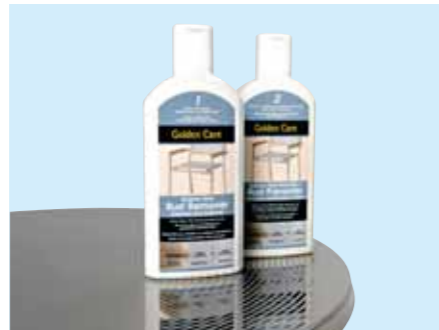
⑩ ステンレス・リムバー ¥4,200 (本体価格¥4,000) 容量/500ml 水溶性