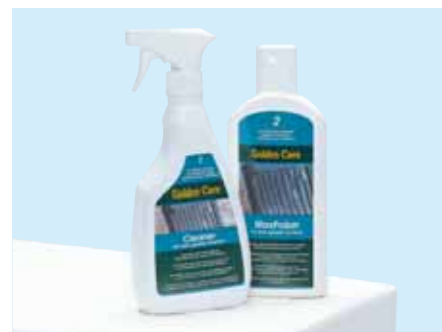
④ レジン・クリーナー ¥2,100 (本体価格¥2,000) 容量/500ml 水溶性