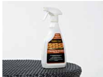
③ ウーヴン・クリーナー ¥3,150 (本体価格¥3,000) 容量/500ml 水溶性