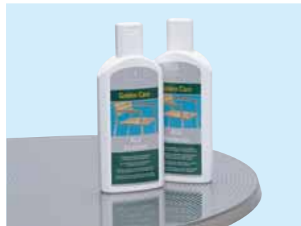
⑧ アル・リストーラー ¥2,100 (本体価格¥2,000) 容量/500ml 水溶性